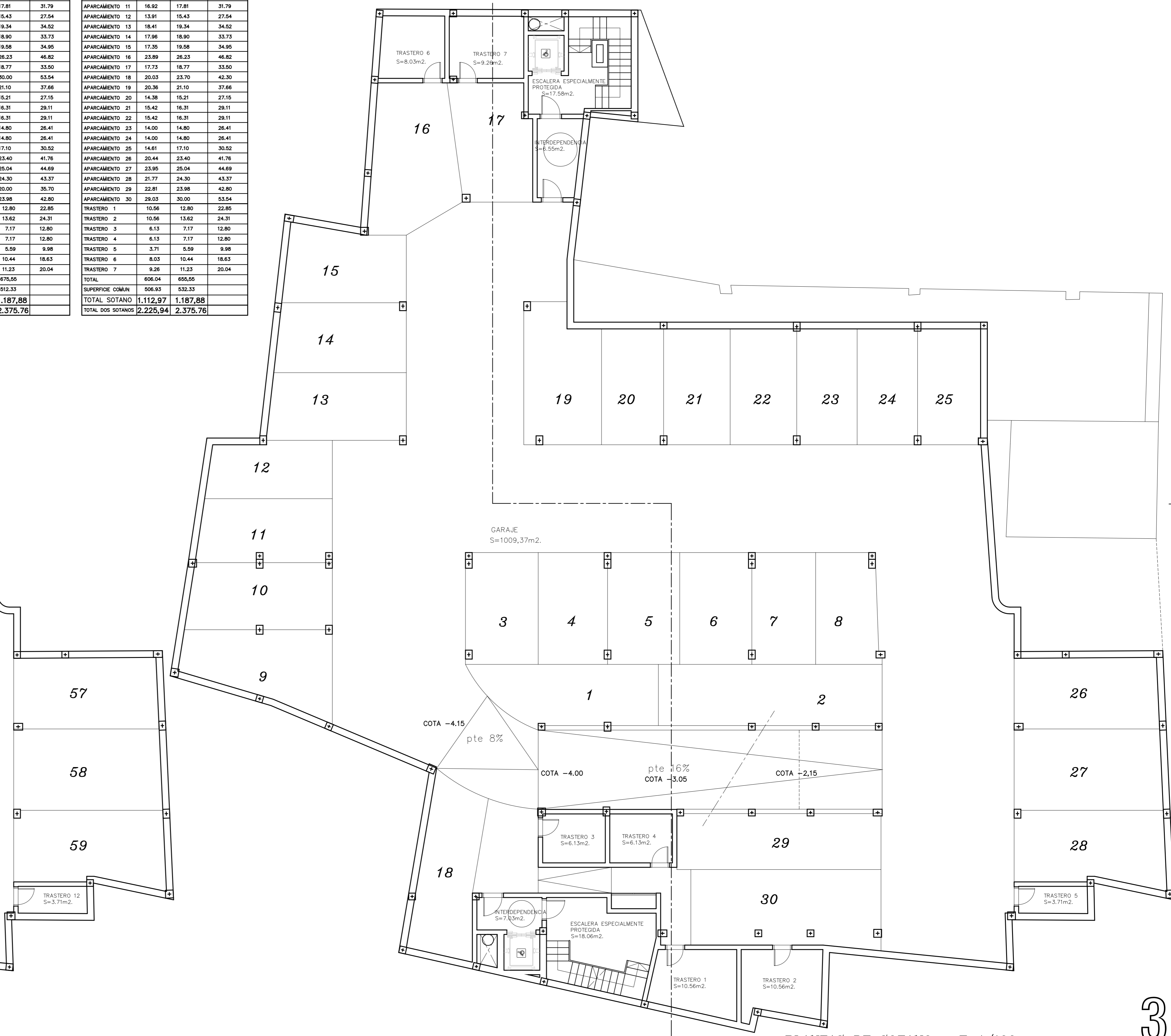
PLANTA SOTANO -1